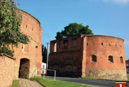
Impozantní vstup do města - Skalická brána