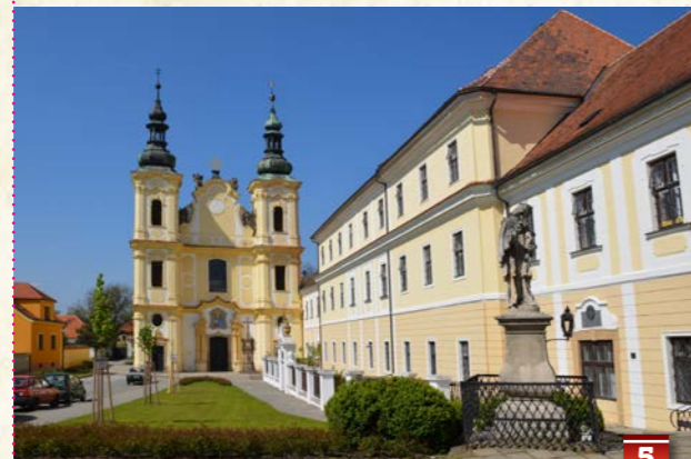
barokní kostel Nanebevzetí Panny Marie