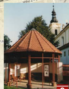
Památník bratrského školství