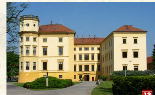
Strážnický zámek s historickou knihovnou, kaplí a atraktivními expozicemi