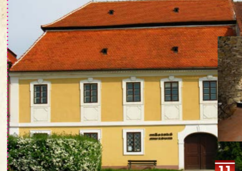
Městské muzeum s expozicí v podzemí