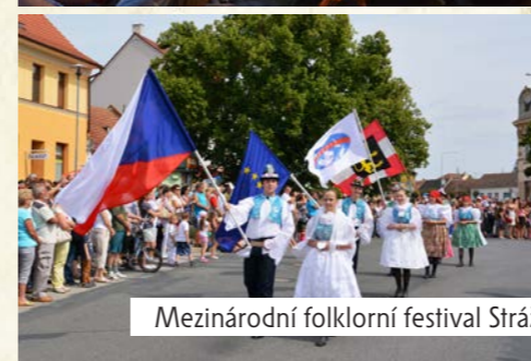
Mezinárodní folklorní festival Strážnice