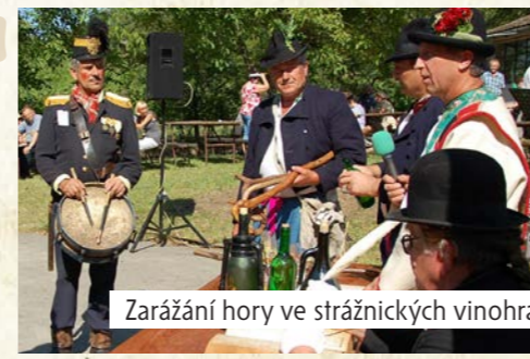
Zarážání hory ve strážnických vinohradech