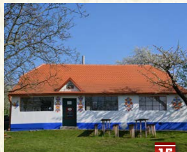
Hotařská buda pod vrchem Žerotín