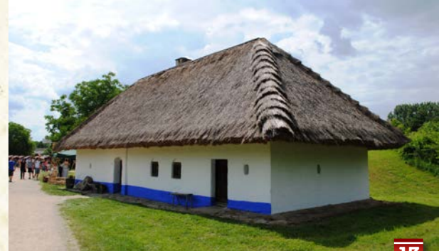
Muzeum vesnice jihovýchodní Moravy - skanzen ukázka bydlení, vinohradnictví, hospodářských staveb, kulturní programy

Vstupné: 50,- Kč, školní mládež a důchodci 25,- Kč, rodinné 100,- Kč Příplatek za cizojazyčný výklad: 100,- Kč