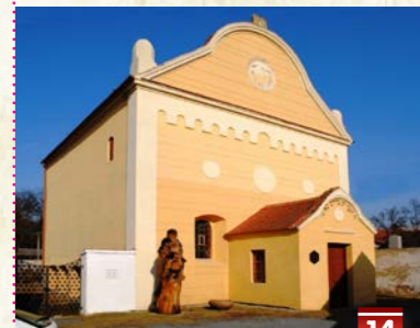
Židovský hřbitov a synagoga

Vstupné: 80,- Kč, školní mládež a důchodci 40,- Kč, rodinné 180,- Kč Cizojazyčný výklad - příplatek 250,- Kč pro skupinu min. 20 návštěvníků, nutno objednat předem