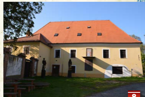
Průzkův mlyn s dřevěným mučícím pranyřem z roku 1601