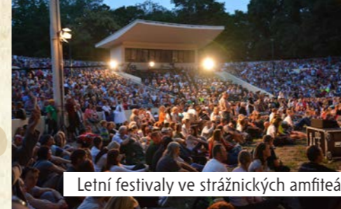
Letní festivaly ve strážnických amfiteátrech