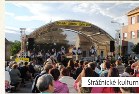
Strážnické kulturní léto