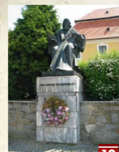
Socha Komenského na Nám. Svobody