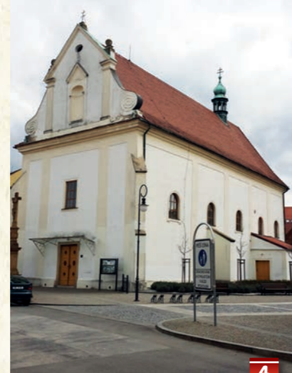
gotický kostel sv. Martina