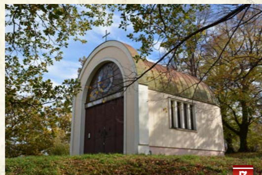
kaple na vrchu Žerotín - nechal ji v roce 1949 postavit místní kožešník jako poděkování za uzdravení syna